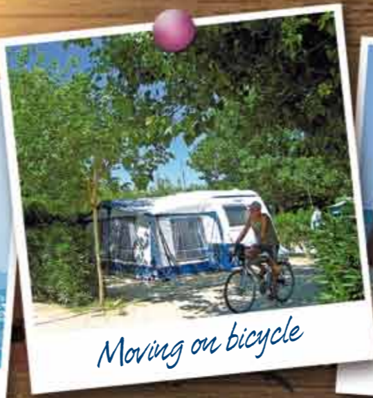
Moving on bicycle