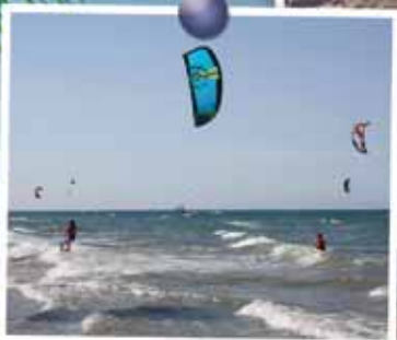
A lot of waves

El Camping Azul , situado junto al mar y entre abundante arboleda, le ofrece todo el equipamiento necesario para el disfrute de unas vacaciones tranquilas, en un ambiente familiar.