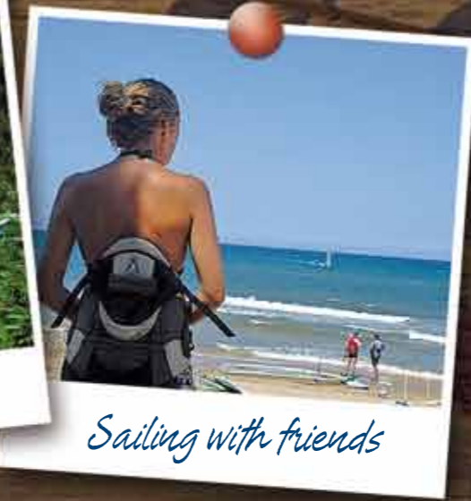
Sailing with friends

Tussen prachtige schaduwrijke boomgroepen ligt Camping Azul direkt aan zee en biedt u alle noodzakelijke voorzieningen om van een rustige vakantie te genieten in een familiale omgeving. Grote individuele parcellen, omzoomd door oleanderhagen. De sfeervolle Bar, alsmede de Supermarkt. Verhuur van volledig ingerichte Houten-Bungalow's "Citôtel" en Bungalowtenten "Trigano". In de zomer, overdag en's avonds biedt de camping u diverse animatieprogramma's en gelegenheid verschillende sporten te beoefenen. Open van Pasen tot 31 oktober. Biedt u korting afhankelijk van seizoen en verblijfsduur.