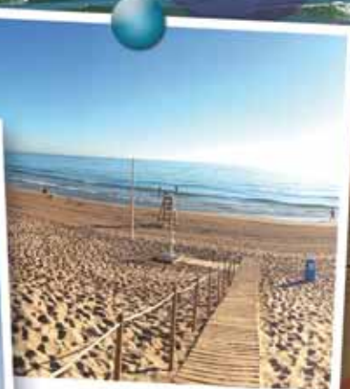
On the beach :)