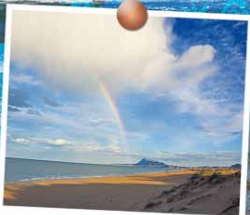
Looking at the rainbow