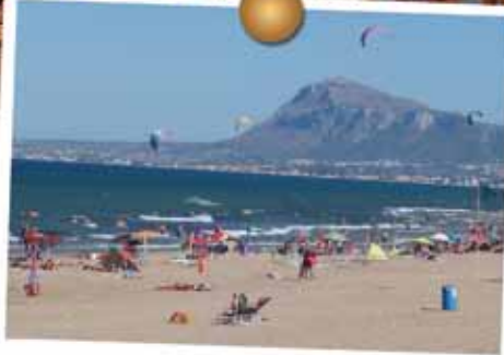
A great spot for kite