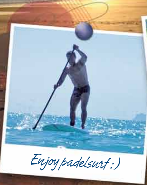
Enjoy padelsurf :)

The Camping Azul lies directly on the fine, sandy beach. Pitches with plenty of shade. It offers all kinds of services to enjoy ones relaxing holidays in a family surroundings. Bar and Supermarket. Spacious individual pitches delimited by plants and flowers. Wood-Bungalows "Citôtel" and Tent-Bungalows "Trigano" entirely equipped. During the summer Social activities for children and adults. Ideal for practice of several sports. Open from Easter to 31 October. Discount according to season and duration of the stay.