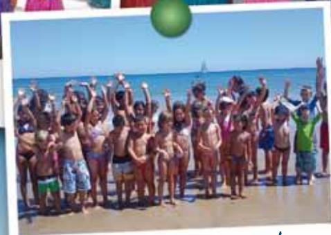
Fun for children!

Zwischen wunderschönen schattenreichen Baumgruppen liegt Campingplatz AZUL direkt am Meer. Der Platz bietet Ihnen alles was man braucht, um einen ruhigen Urlaub in familiärer Umgebung zu verbringen.